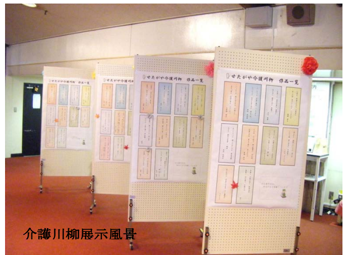
介護川柳展示風景